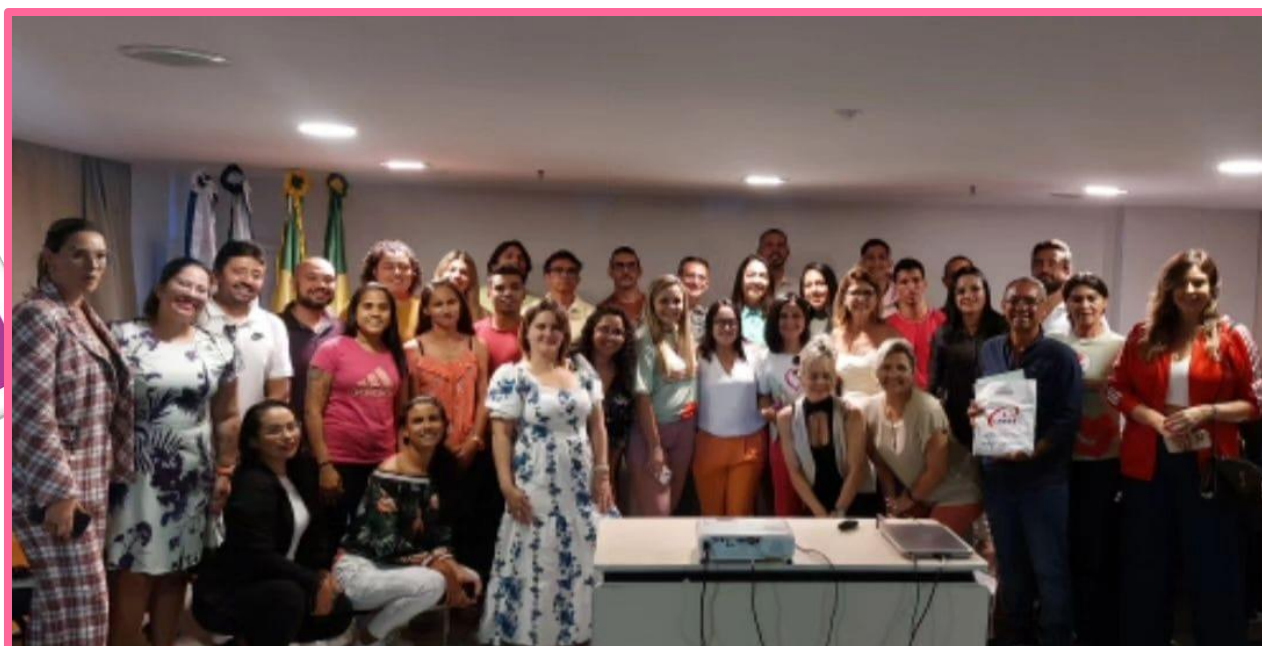
Participação do PAC na Homenagem às Mulheres que se destacaram no empreendedorismo no Esporte.