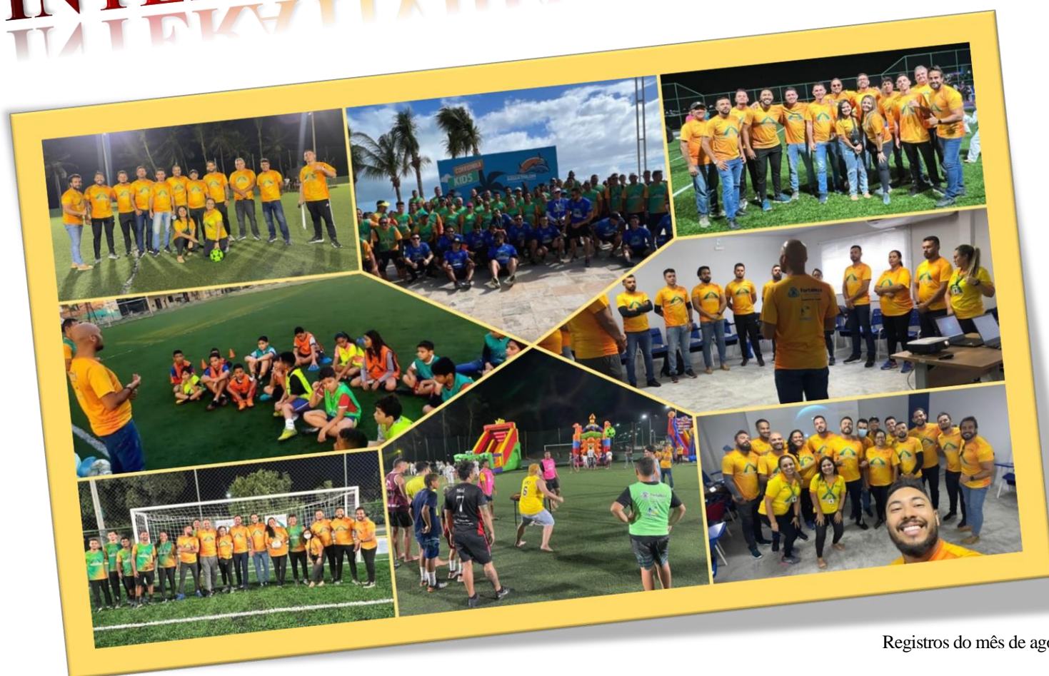
Registros do mês de agosto.