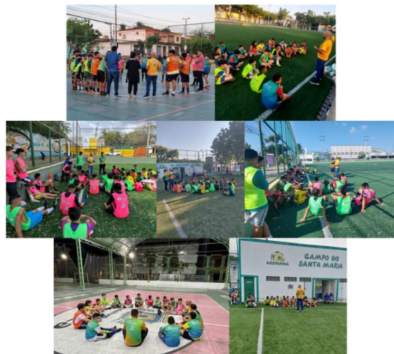
Ações do Serviço Social.

Além da organização do processo de educação permanente, por meio de material de apoio e reuniões de planejamento para o andamento das atividades de Serviço Social no PAC, com assessoria à Fetriece.