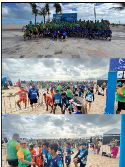
7ª Corridinha Kids.