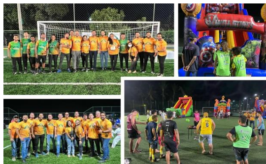
Registros das inaugurações.

Com os espaços urbanizados e requalificados os equipamentos se somam às mais de 100 areninhas presentes em Fortaleza.