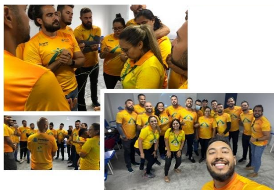
Reunião de planejamento.

Houve ainda o mapeamento dos núcleos de empoderamento feminino e deliberações para a Copa PAC Sub-16, agendamentos do futmesa, e demais eventos.