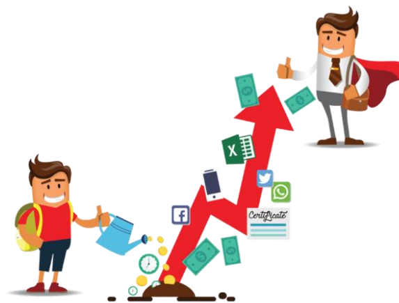
Homenagem ao Dia do Estagiário.

Atualmente o PAC conta com aproximadamente 65 estagiários distribuídos em todas as regionais da capital cearense.