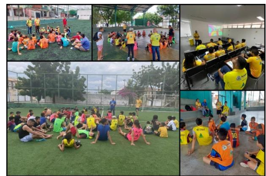
Ações do Serviço Social.

Somam-se a isso, as ações de organização do processo de educação permanente, por meio de material de apoio e reuniões de planejamento para o andamento das atividades de Serviço Social no PAC, com assessoria à Fetricee.