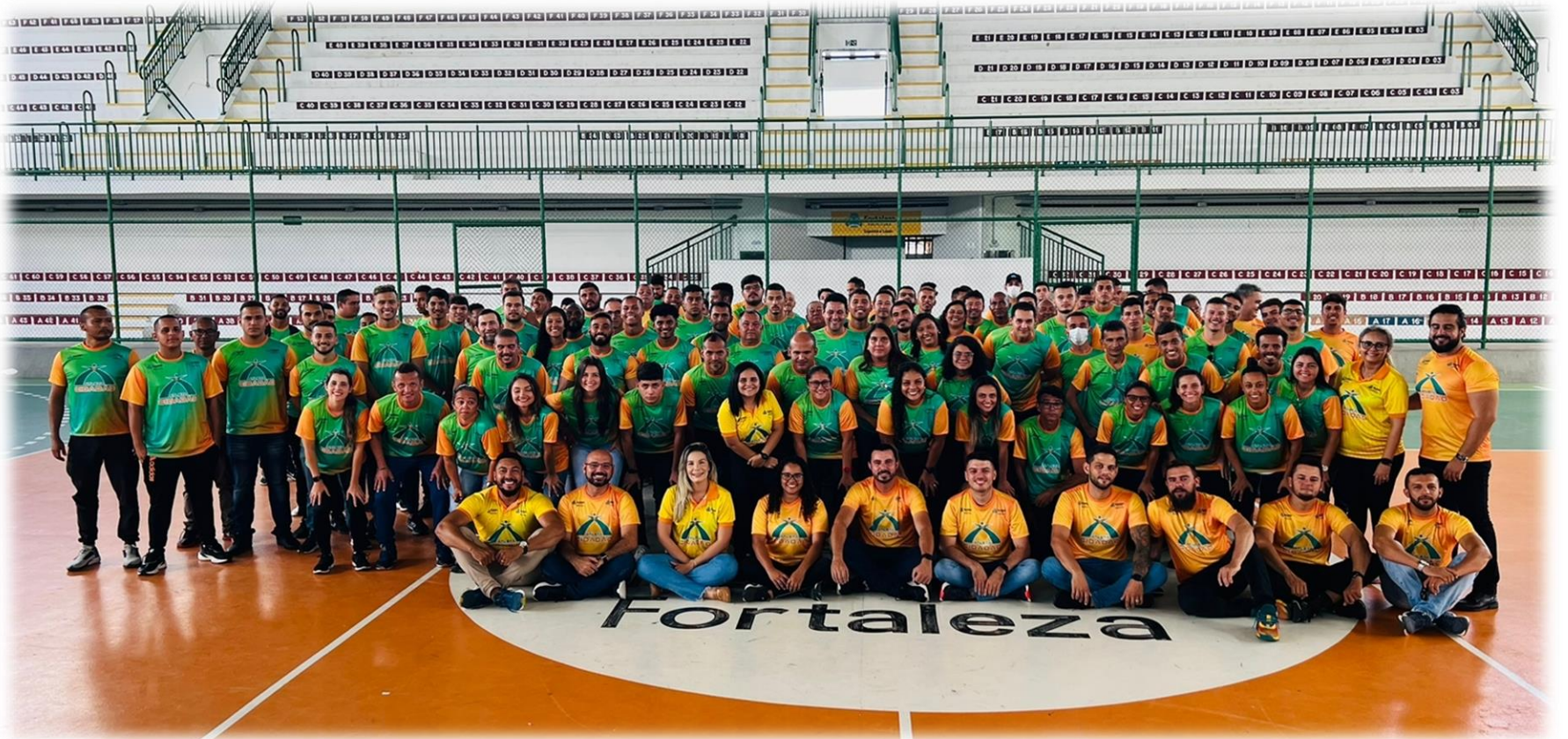
Registro da Reunião Geral do PAC em janeiro.