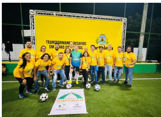
Inauguração da Areninha Campo do Canto do Rio.