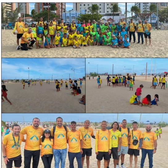
Torneio de Beach Soccer.

Um exemplo disso foi o torneio de Beach Soccer ocorrido no último dia 06 de janeiro às 16h no núcleo esportivo do Aterro da Praia de Iracema (Professor Dito Moura), reunindo dos alunos do local e inscritos no núcleo Poço da Draga (Professor Ricardo Coutinho).