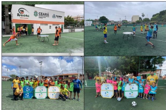
Futmesa no meu Núcleo.

O intuito, além de promover a diversão dos alunos é apresentar a modalidade e envolver a comunidade no planejamento de aulas dos espaços esportivo, o que tem trazidos bom retorno entre os profissionais.