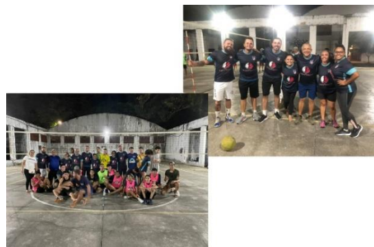
Jogo de Vôlei na Igreja Betesda.