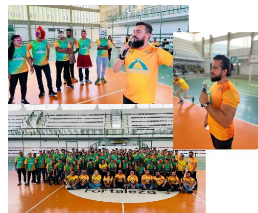
Registros da Reunião Geral.